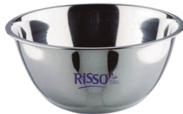
BOL DE ACERO INOXIDABLE