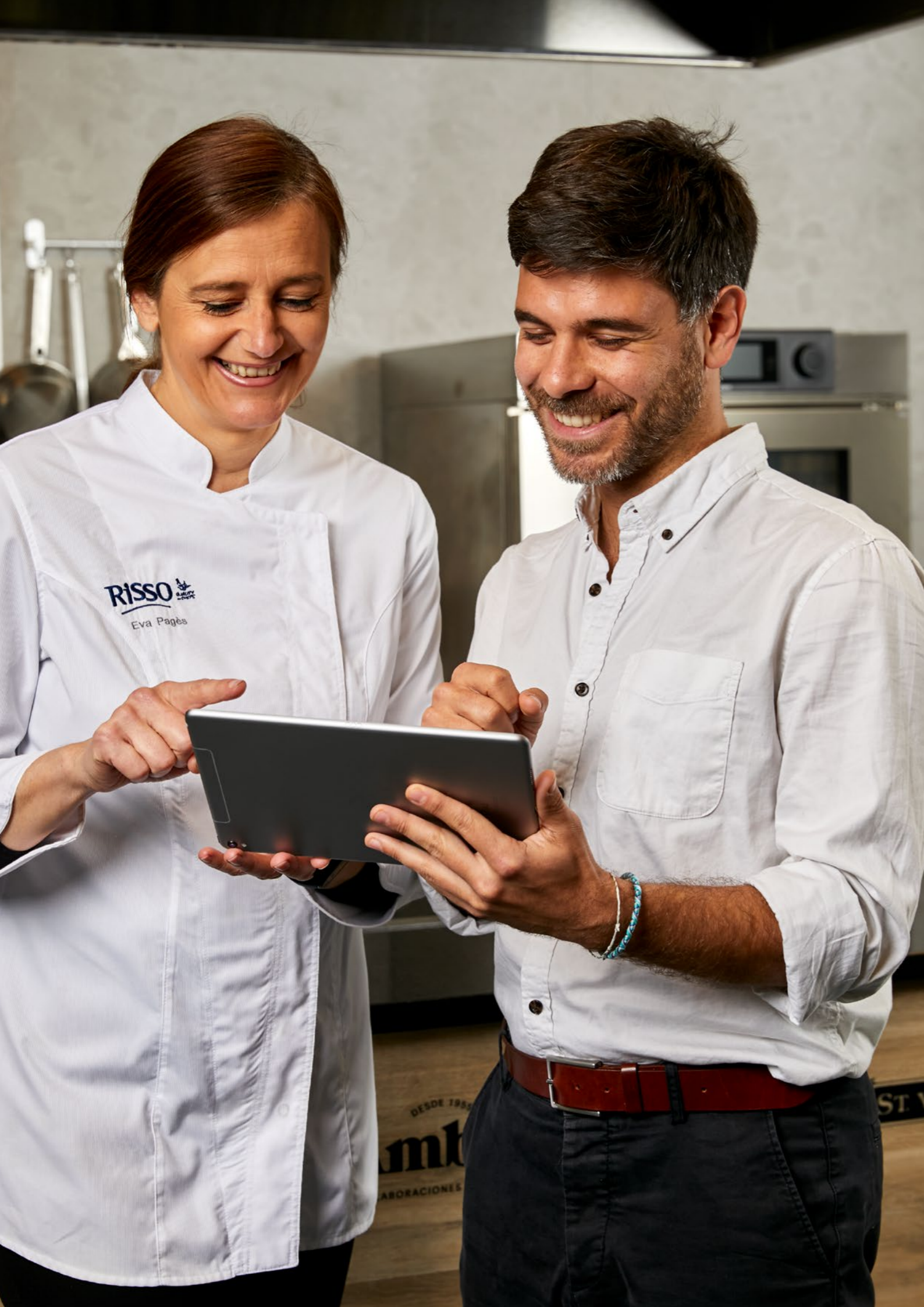
TABLA DE ALÉRGENOS E INTOLERANCIAS

Descubre los alérgenos e intolerancias que puedes encontrar en la composición de los productos Risso® así como alguna de sus principales características.