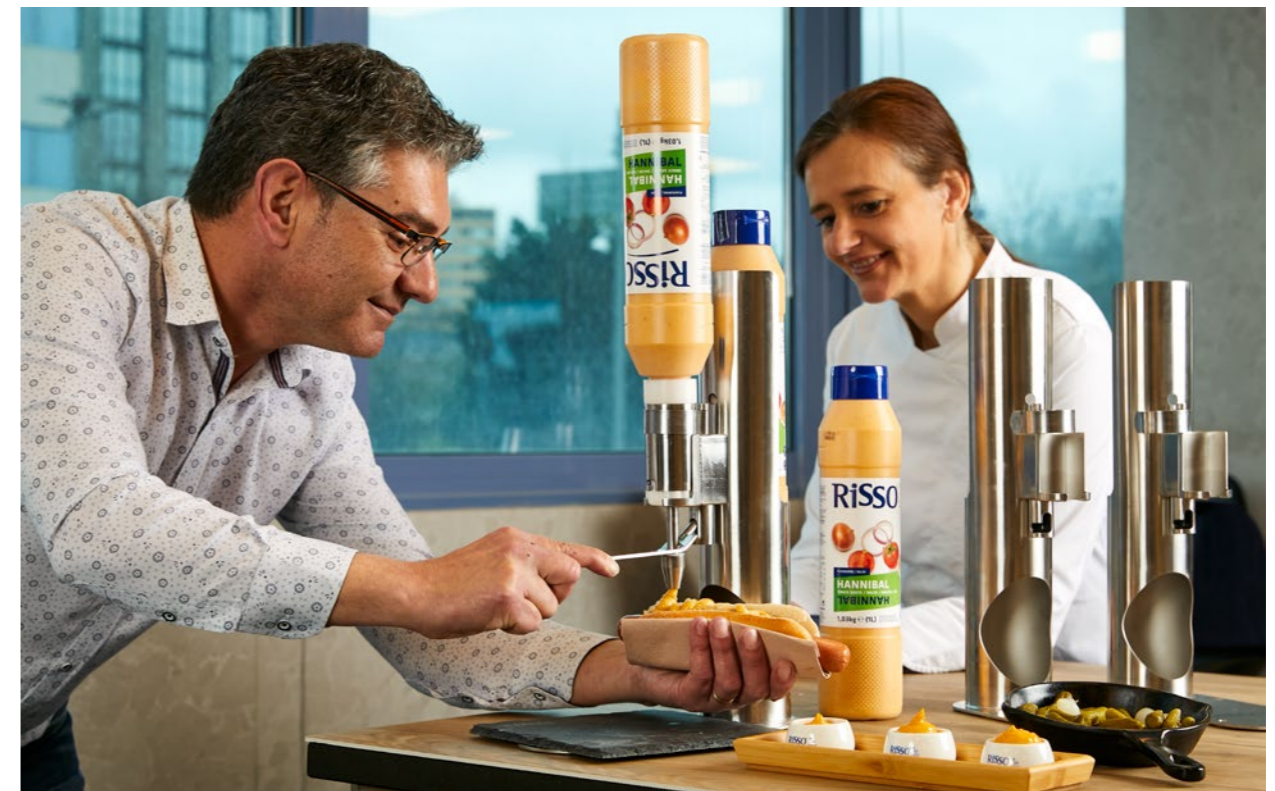
DISPENSADORES 1L Y 5L